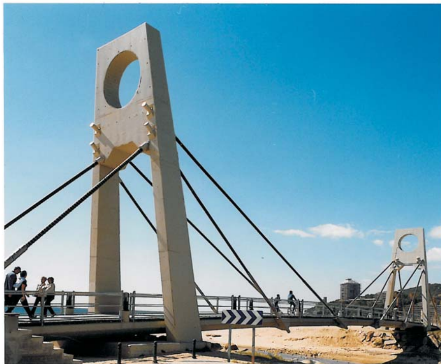
Vista del pont