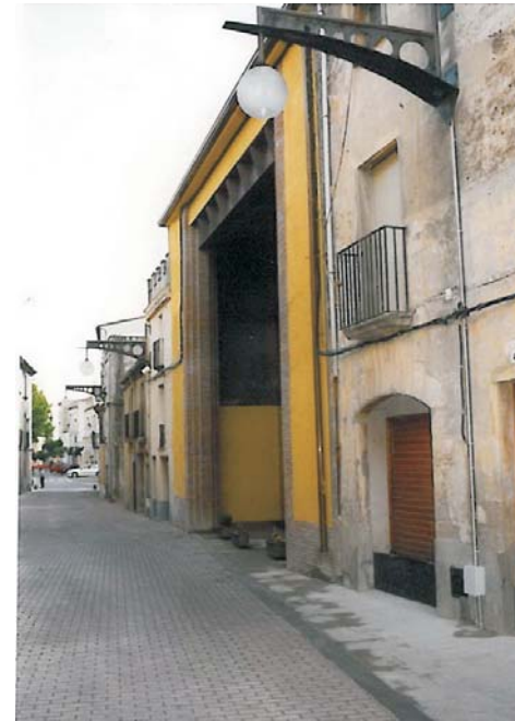
vistes del carrer