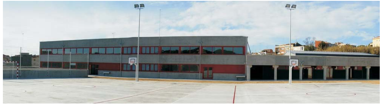
Vista façana est